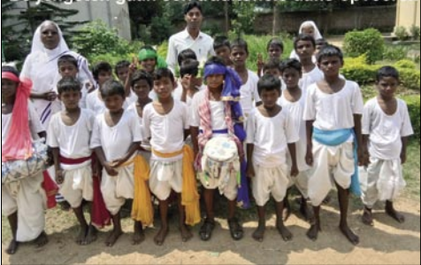
De jongsten gaan een traditionele dans opvoeren

Begeleide toegang tot het gebruik van computers is bevorderlijk voor het leerproces maar ook voor ontspanning.